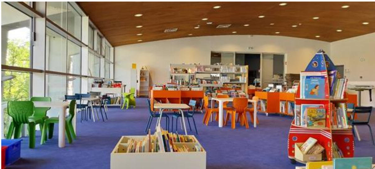
L'espace jeune public de la médiathèque Neudorf, rénové en avril 2024

NB : les médiathèques vont être intégrées au dispositif 100% EAC de la Ville de Strasbourg (CTEAC - Contrat territorial Éducation artistique et culturelle)